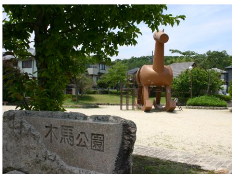
▲学研地区内の公園

全体的には、場所の数量、設備等の問題が指摘されているものの、周辺で一定の野外活動場所が確保されていることがうかがえます。主な野外活動場所は、木津川市内では、学研地区内の公園、木津川、当尾の里であり、その他奈良公園、けいはんな記念公園（精華町）、木津川河川敷（木津川市、笠置町）などです。広がりのある野外活動場所として、周辺の山や木津川への志向が表れています。