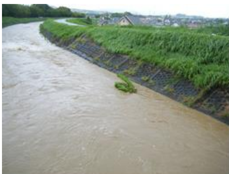
▲山城地域の天井川

これまで自然災害の予防に向けて、河川改修などの河川防災を行うとともに、荒廃地、土砂災害危険地等を整備し、森林の維持、造成を通じて土砂災害から市民の生命、財産を守る土砂災害防災及び林地保全を進めています。そのうち林地保全では、治山事業を実施し、保安林の機能の維持増進を図るとともに、森林の防災機能を高め、水源かん養機能と保健機能を有機的に発揮する保安林を拡充し、生活環境の保全とあわせて地域の防災施設の計画的な整備を進めています。