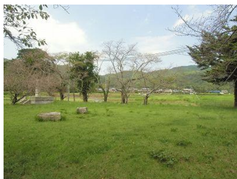
▲ 恭仁宮跡（山城国分寺跡）

この景観計画では、学研都市内の文化学術研究地区を主に対象として、緑化やセットバック（道路からの壁面後退距離）などを景観形成基準として示しているものであり、既存市街地に適用されているものではないですが、その景観形成の考え方を踏まえた地域の景観形成を検討する必要があります。