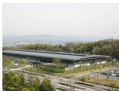
▲ 学研地区内の研究所