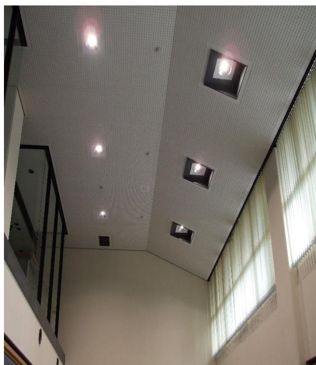
工事後:吹き抜け LED 照明