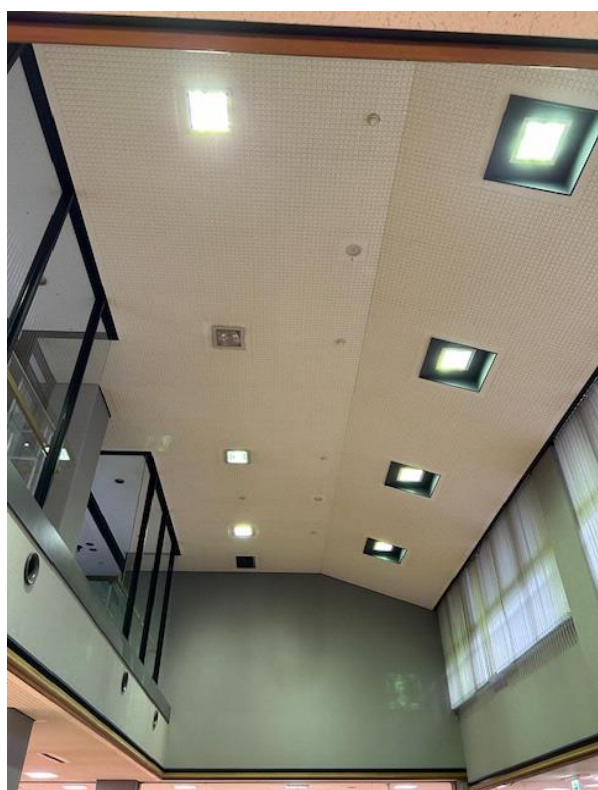
工事前:吹き抜け水銀灯