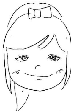
足立委員 (加茂地区)