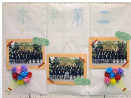
【木津第二中学校区】