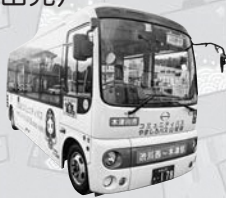
やましろバス山城線