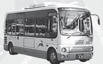
きのつバス・奈良交通バス