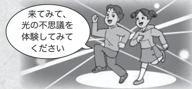
※これはイメージです。