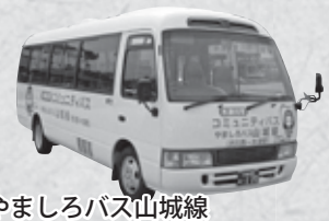
やましろバス山城線