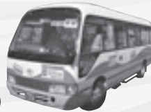
やましろバス 山城線