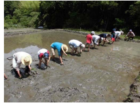
みもろつく鹿背山里山学校 (田植えの様子)

平成30年度は田植えや稲刈り、サツマイモの植え付け・収穫などの農業体験や、ハイキングや燻竹体験といった作業を通して里山活動を体験していただきました。