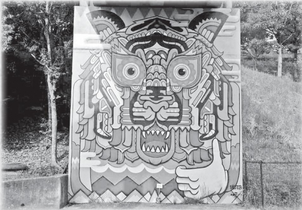
MOT8さんの作品は、大阪南港ATC「海辺のステージ」前の階段にもあるよ!!

高の原周辺へ買い物などに行くついでに、アート作品まで足を伸ばしてみてくださいはいかがですか。