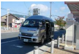
加茂路線 運行車両