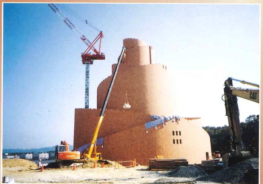
⑦外装工事・付帯工事(盛土)