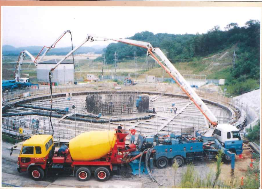
②基礎工事(底版コンクリート打設)