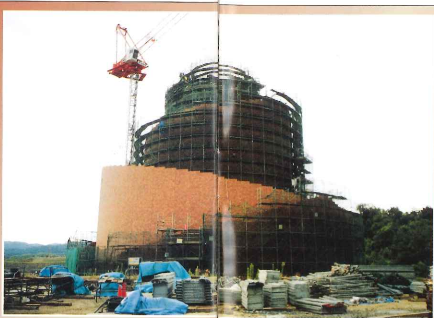
⑥躯体工事・外装工事(タイル張り)