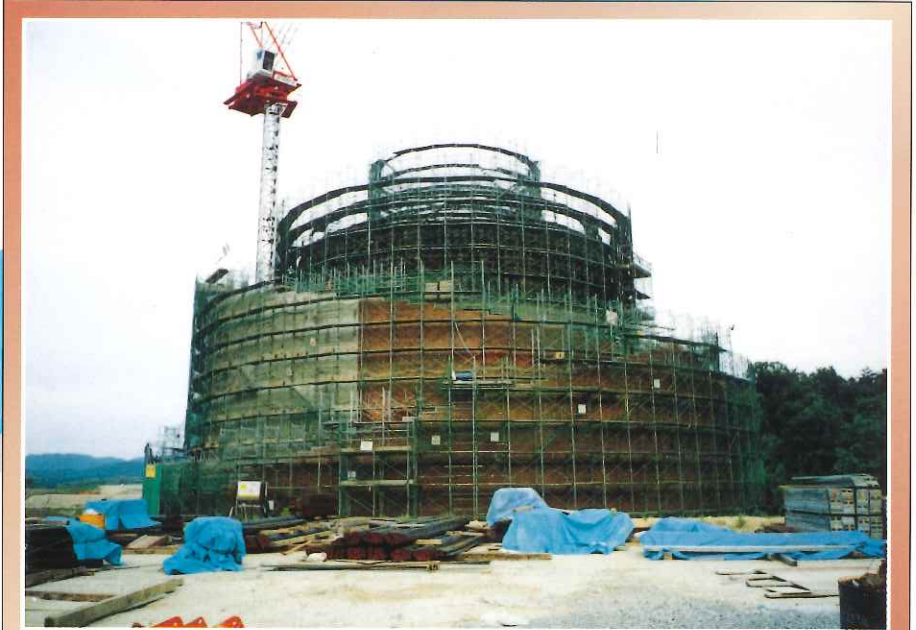
⑤躯体工事・外装工事(タイル張り)