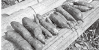
収穫したさつまいもや冬瓜が 今回のお土産に！

今後もいろいろなプログラムが盛りだくさんです。1回のみ参加も可能ですので、参加ください。