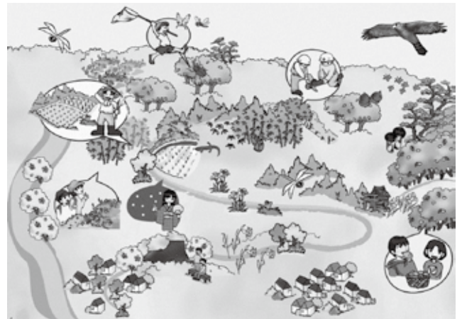
計画の将来像(イメージ図)