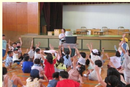
放課後子ども教室(パネルシアター)