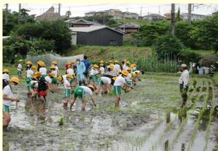
地域学校協働本部事業(収穫体験授業補助)