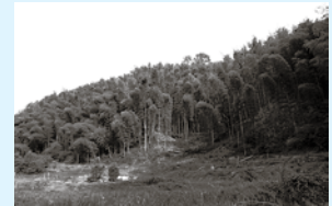
学研木津北地区の竹林