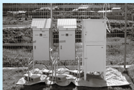
[塩化水素、ダイオキシン類、浮遊粉じん量調査機器]