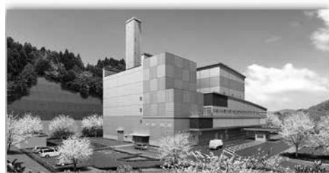
環境の森センター・きづがわの完成イメージ図 ※実施設計により変更する場合があります。