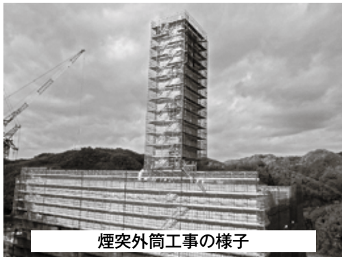
煙突外筒工事の様子

11月の建築工事では、煙突外筒の外壁用鋼板の張り付けをおこないました。先月号で紹介しました煙突内筒は、この外筒の中に納まっています。