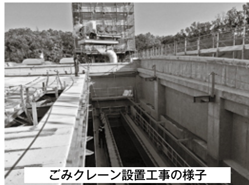
ごみクレーン設置工事の様子

“環境の森センター・きづがわ”の早期稼働に向けて、地元の皆さんをはじめ市民の皆さん、一人ひとりのご理解とご協力をお願いします。