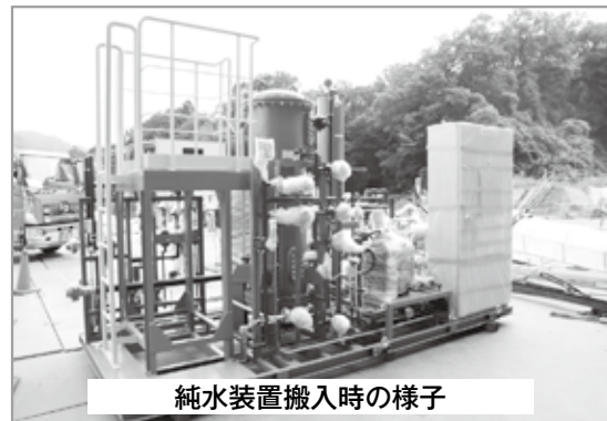
純水装置搬入時の様子

“環境の森センター・きづがわ”の早期稼働に向けて、地元の皆さんをはじめ市民の皆さん、一人ひとりのご理解とご協力をお願いします。