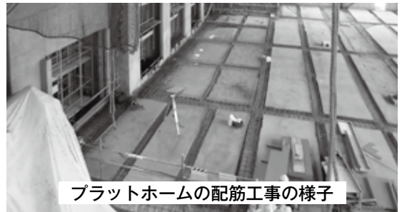
プラットホームの配筋工事の様子

プラットホームには、パッカー車がごみを投入するための3基の投入扉や、住民の方が直接持込まれたごみを安全に投入するためのダンピングボックスを備えています。車両の出入りがスムーズにおこなえるよう広々としたスペースになっています。