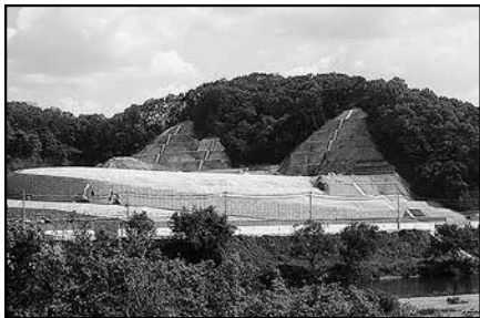
木津川対岸にある国道163号からの現場状況

敷地造成工事の詳細な状況は、工事受注者の戸田・村井・清水特定建設工事共同企業体のホームページ ( http://kizugawacc.sakura.ne.jp/ ) をご覧ください。