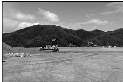
クリーンセンター建設予定地の整地状況