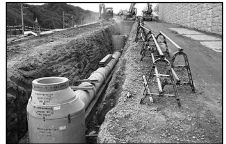
雨水排水管の設置工事の状況