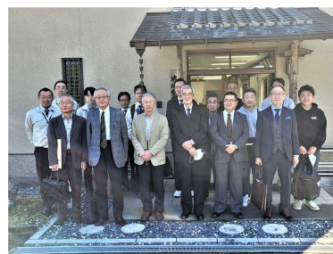
集合写真（彩都東部地区C区域土地区画整理組合の皆様、茨木市都市整備部北部整備推進課の皆様と）

視察日時：11月2日（水）9時～17時 視察場所：彩都東部地区C区域土地区画整理事業地（大阪府茨木市） 京都山城白坂テクノパーク（京都府城陽市・井手町） 出席者：準備組合役員、事務局、アドバイザー（FSJホールディングス、UR都市機構）