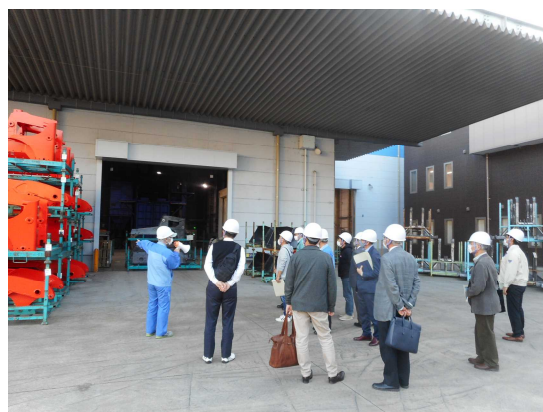
白坂テクノパーク内工場見学の様子