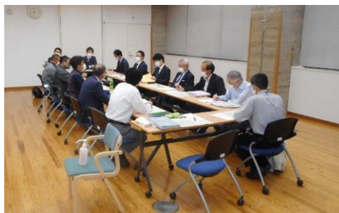
(当日の会議の様子)

この日は、意向調査の質問項目の確認や、まちづくり協議会の開催スケジュールについて、意見交換などを行いました。