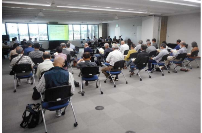
(当日の会場の様子)

今後は、まちづくり協議会事務局会議で事業計画(たたき台案)や意向調査票について検討を進めていきます。