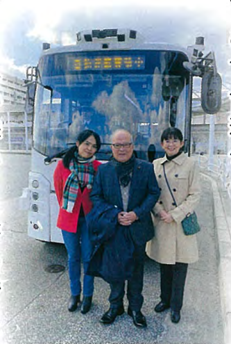
自動運転バスの試乗体験（城山台）