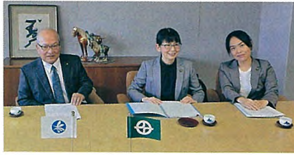
京田辺市庁舎にて消防行政研修

視察した京田辺市は委託方式を採用し、市が主体的かつ迅速に対応し、地域に合った体制を整えられる仕組みであり、課題解決の現実的な選択肢であることを確認しました。