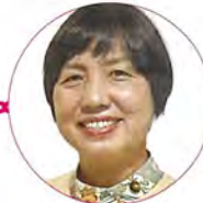
糸数 貴子氏 (沖縄県那覇市議会議員)