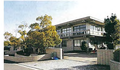
今後、更新工事が始まる吐師受水場

今後は、困窮家庭を守る福祉的減免の必要性和、水道事業の現状や将来像を共有する住民参加型ワークショップの実施を訴えていきます。