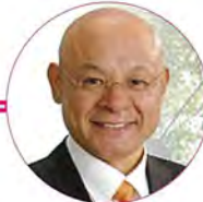
林 伊佐雄氏 (埼玉県三芳町長)