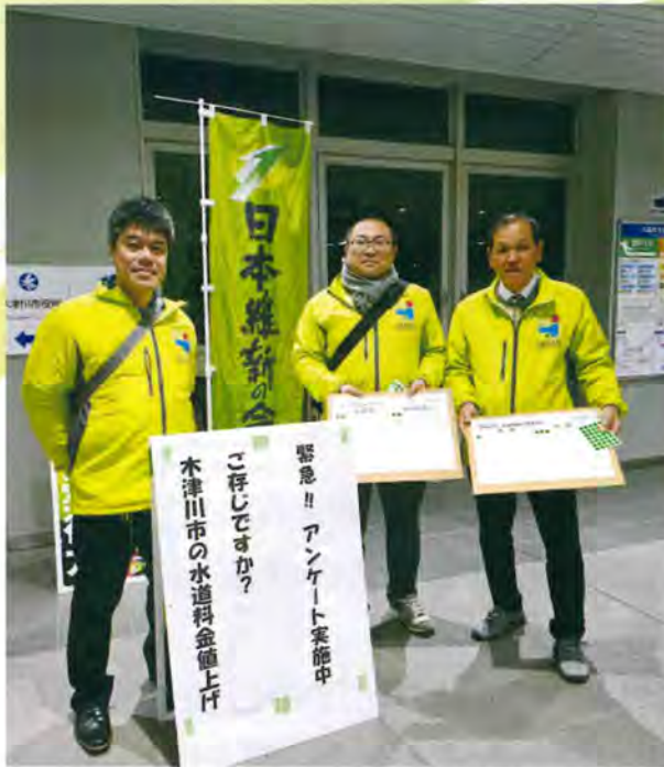
12月議会に先立ち、JR木津駅と市役所南公園にて、緊急街頭アンケートを実施しました (JR木津駅にて)

市は7年12月議会に水道料金引き上げを内容とする条例改正案を提案し、賛成多数で可決されました。これにより8年5月使用量からの値上げが決定しました。しかし、「日本維新の会」は、今回の値上げは以下の理由により不適切として反対しました。