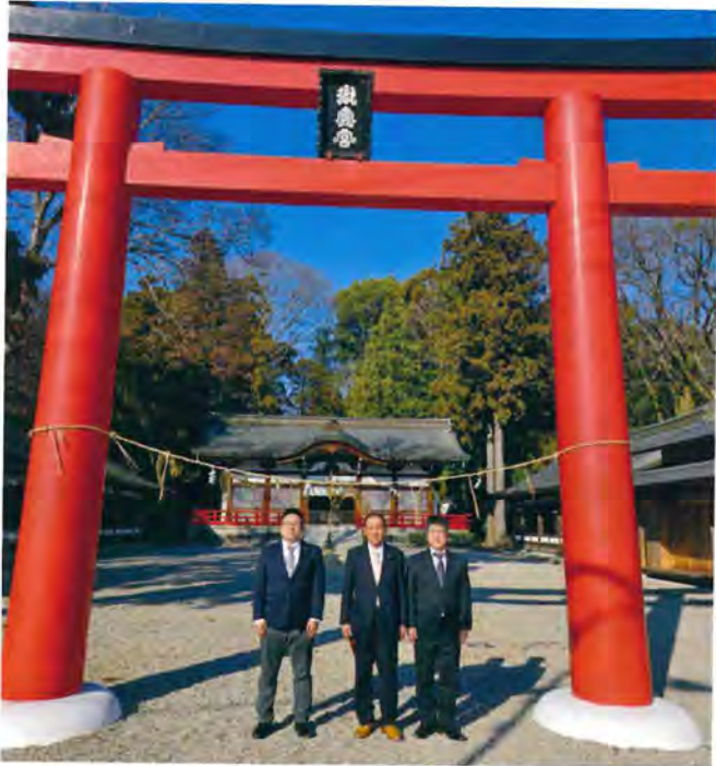
会派で揃って初詣へ 「本市の今年一年の息災を祈って」 (木津宮ノ裏の御霊神社にて)