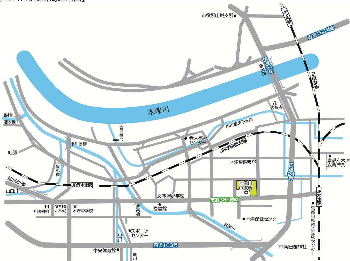
【木津川市役所周辺地図】