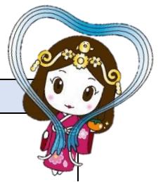
木津川市マスコット キャラクター「いづみ姫」