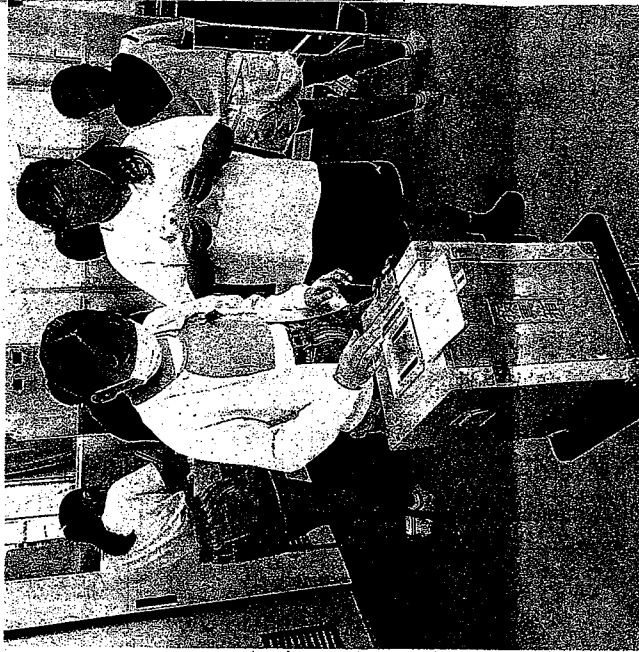
投票箱に票を投じる児童たち(木津川市山城町・柳倉小)