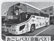
おこしバス(京阪バス)