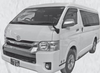
かもバス加茂通学線