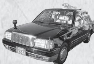
かもバス予約型路線

▶予約型路線の大畑線・観音寺線・銭司線について、1日の運行便数を4往復(8便)から3往復(6便)に変更します。