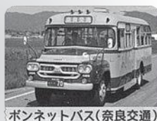
ボンネットバス(奈良交通)