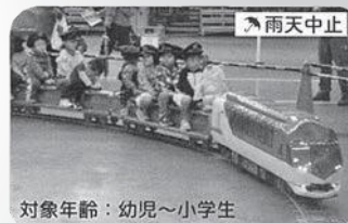
対象年齢：幼児～小学生