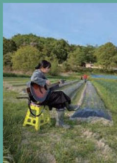
畑で楽器の演奏をしました。自然の中で奏でる音はいつもと違う心地よさがありました。

私たちは、南加茂台公民館を拠点に活動しています。地域の行事に参加したり、日々の出来事を一緒に体験したりしながら、まちの魅力を言葉や写真で伝えていきます。ただ取材するだけでなく、地域の一員として関わること。それが、私たちの役目です。