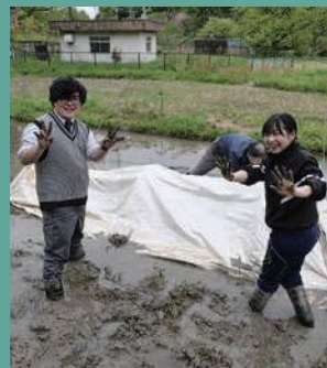
南加茂台小学校での田植え体験に参加しました。田んぼのある地域でしか味わえない貴重な時間を過ごしました。