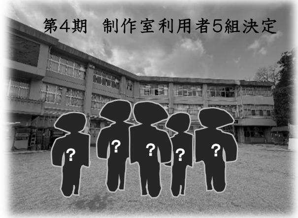
第4期 制作室利用者5組決定

平成30年4月から取り組んでいます、「当尾の郷会館 CREATION PROJECT」（制作活動を通じ、地域の皆さまとの交流機会を設け、当尾地域の活性化を目的とした事業）についてお知らせします。今回は第4期として、多数募集がありましたが、 当尾地域長及び当尾の郷会館管理運営委員会会長とともに審査した結果、5組のアーティストを決定しました。