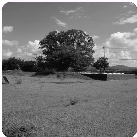
高麗寺遺跡公園の保全と活用に向けて

A マチオモイ 重要なデジタル戦略を推進する上で、多様な人材による体制を心がけていく。