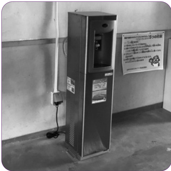
熱中症対策に冷たくおいしい水を（泉南市）

Q ①小中学校に冷水機を設置しては。 ②庁舎及び市の施設に冷水機を設置しては。 ③市民がよく利用する駅前や公園への冷水機の設置の考えは。 A 教育部・総務部他 ①原則は家庭からの水筒持参であり、設置の