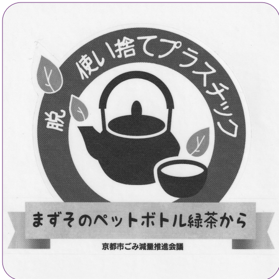
減らそう、使い捨てプラスチック（京都市ごみ減量推進会議）