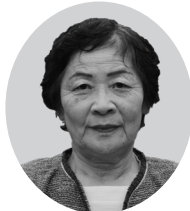
新風コスモスの会