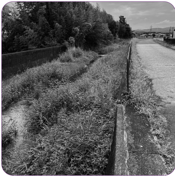
川底の浚渫が望まれる山城町天神川