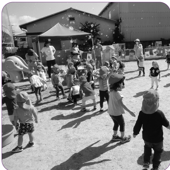
保護者の負担軽減を（いづみ保育園）

A 健康福祉部 支援方法の変更等を協議し、より良い支援に取り組む。 Q 第7波感染拡大の対策は A 健康福祉部 「京都BA・5対策強化宣言」が延長された。救急搬送困難事案の増