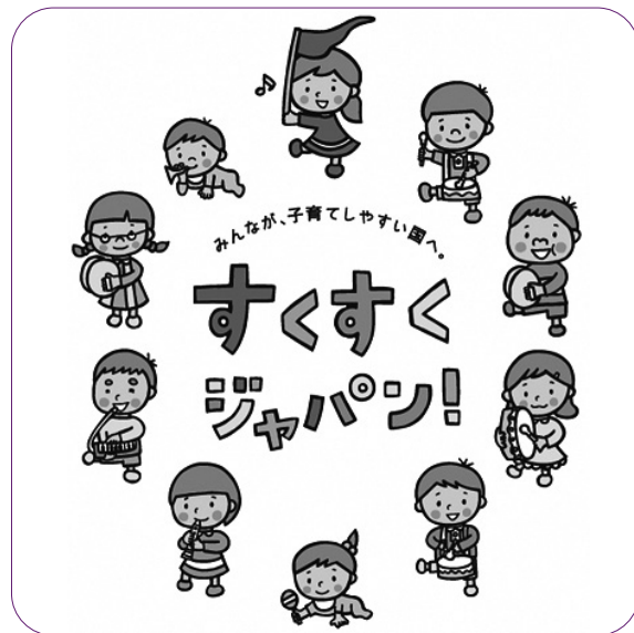
子どもたちは私たちの宝 そして未来（内閣府）