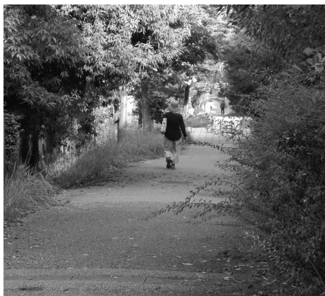
剪定前の兜台の市道