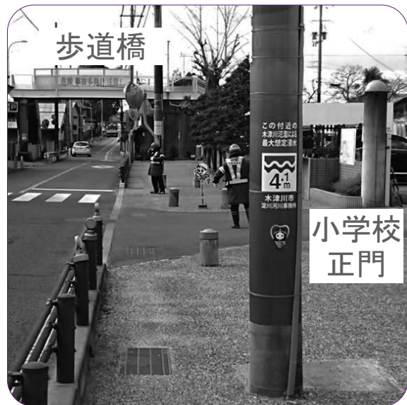
電柱標記の前に 水害から街を守れ