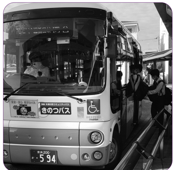
コミバスの役目は移動の自由を保障すること

A マチオモイ①路線維持の要望を行っている。コミバス利用者は回復しつつある。②福祉事業と考えていない。現行運賃を続けたい。