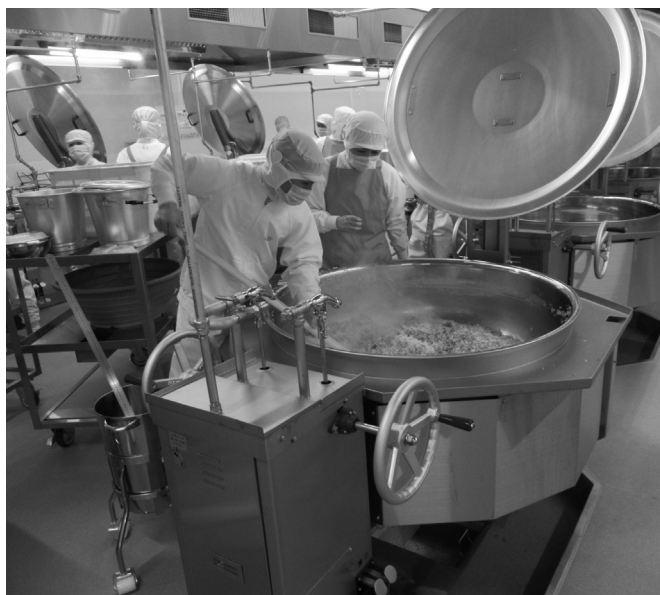
ますます値上がる食材費（第一学校給食センター）