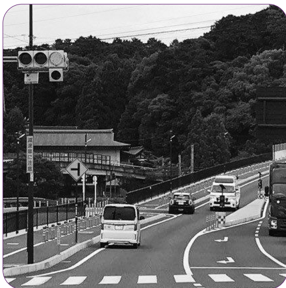
追い越しでさび対向車線を走る救急車（大谷交差点）