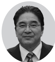
新風コスモスの会