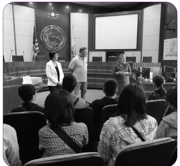
将来を担う人材となれ (米サンタモニカへの中学生海外派遣事業)

ソフト事業として、人材育成も含め、住民の日常的な交通手段の確保等、将来にわたり安心できる地域社会の実現を図っていく。