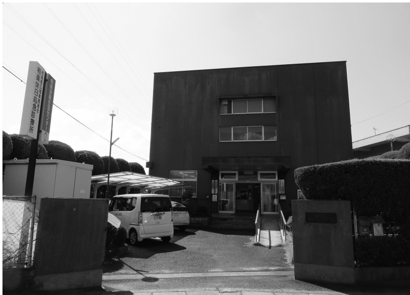
改築予定の相楽会館