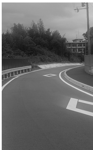
木津高へのアクセス道路が完成