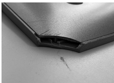
修繕が必要なタブレット