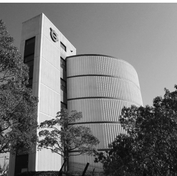
相楽東配水池耐震補強工事が完了（相楽台）