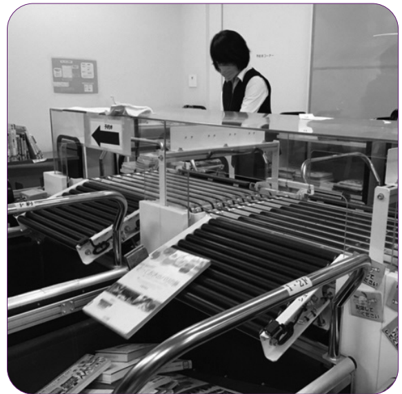
返却図書の自動選別機（大和市文化創造拠点シリウス）