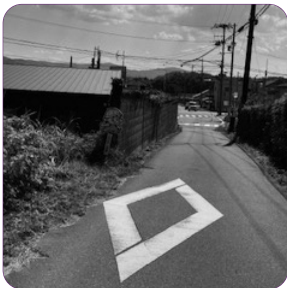
道路改良に支障をきたす塀（市道1-1）

中学校部活の地域移行は Q ①部活の現状は。②部活検討委員会は。③保護者負担、教員との連携、指導者の確保など課題が多いが。 A 教育部①外部指導者 は6人。部活動指導員は6人。②校長と協議を進めている。③スポーツ関係団体等、情報を共有して進めて行きたい。