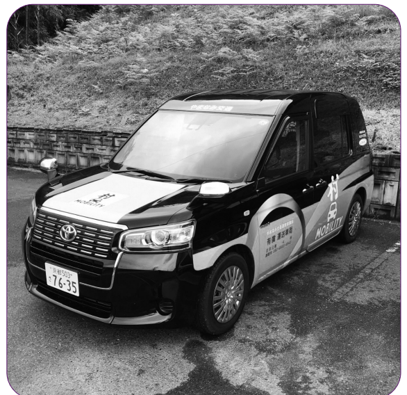
市民に便利な交通施策を（南山城村の「村タク」）

A 健康福祉部 防災・福祉部門が研修を受け、情報共有している。今後、福祉の専門家も交え必要な対象者から作成していく。