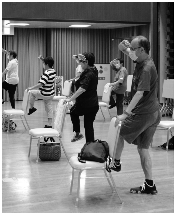
介護予防サポーター養成講座（いずみホール）