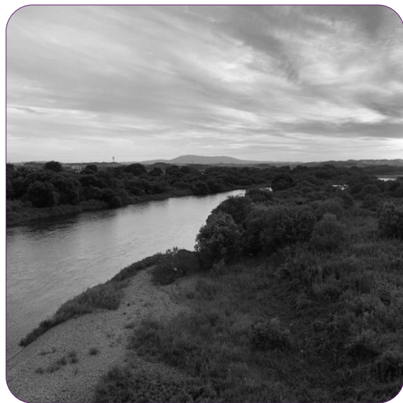
泉大橋付近の川の樹木は伐採を