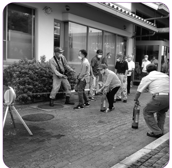
日頃の消防訓練が大事 的を目指して

Q ひきこもりは、長期化により「8050問題」など様々な課題がある。 A 健康福祉部「断らない相談支援体制」を強化。「チーム絆」など重層的な支援を実施。