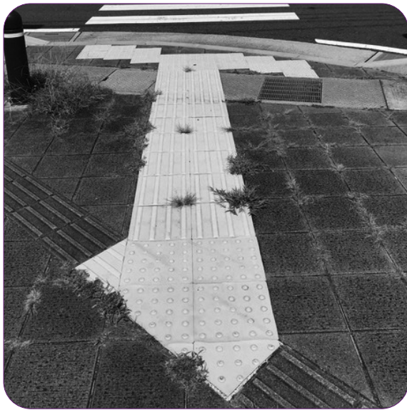
輝度（明るさ）が損なわれている市役所横の点字ブロック