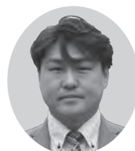
新風コスモスの会