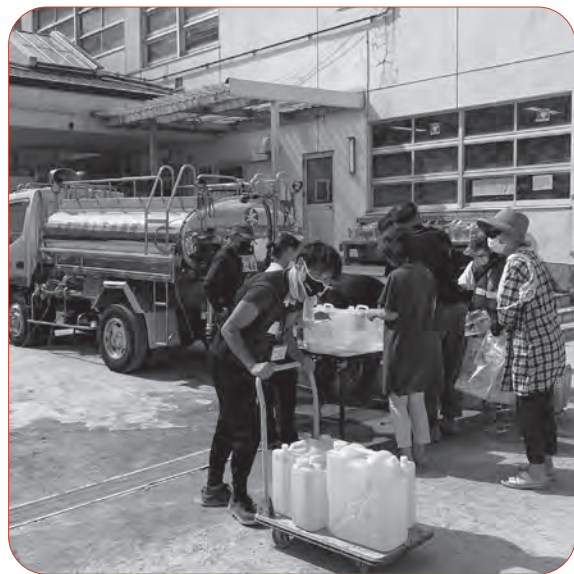
水道橋崩落事故（和歌山市）を受けて応急給水に出動