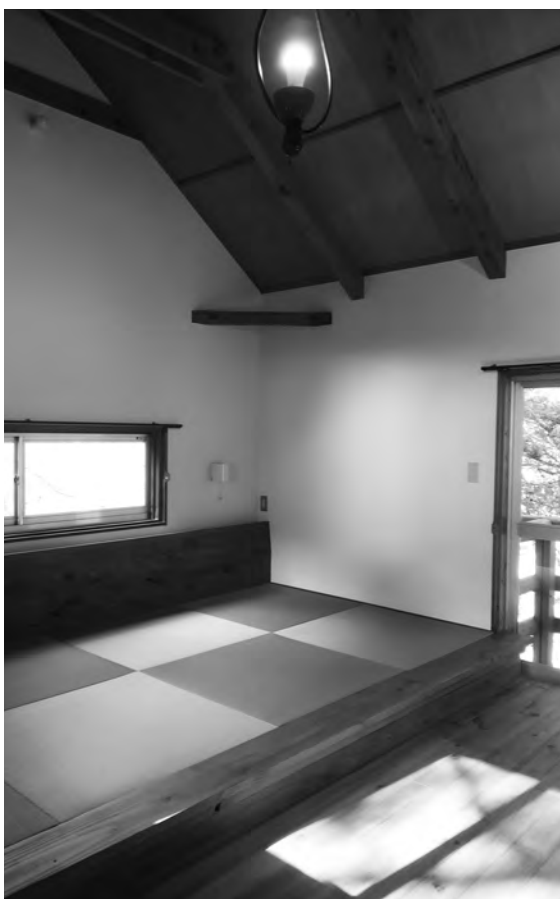
「木の温もり溢れる空間」 ～山城町森林公園ログハウス～