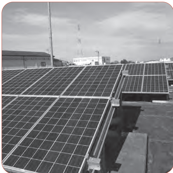
市内の農地を有効活用した太陽光発電設備

Q 小中学生の環境教育の取り組みは。 A 教育部 社会科や理科などで環境、資源、エネルギー問題を学習。体験活動と課題解決型学習を通じ、子どもたちが主体的に環境保全に向けた行動が取れるよう学校教育全体で取り組む。