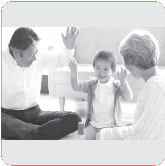
少子高齢化は深刻な社会問題

Q 人口問題に対して戦略を講じなければ2030年をピークに減少に転じるとの推計であるが、取り組みは。