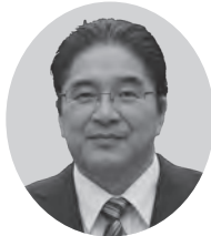
新風コスモスの会