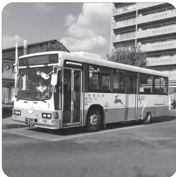
JR大和路線や奈良交通の「加茂～JR奈良駅西口行き」も減便となった

A 健康福祉部 「新型コロナウイルスワクチン接種証明書の発行の要望があった。申請すれば全ての住民に発行できるのか。」 A マチオモイ 「新型コロナウイルスワクチン接種証明証（臨時）」が全国統一規格と説明した上で、希望者にはA4の市独自様式の「接種済証明書」を発行。