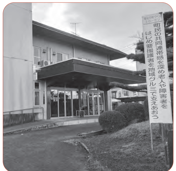
社会福祉協議会を中心に他組織と連携しサポート

なり浸水被害が発生した。 施設完成後は、同程度の 雨量に対応できるのか。 建設部 十分に対応 できる。 Q 木津小学校運動場 の周辺への浸水対策は。 建設部 小川からの 逆流防止装置を設置 した。4年度は排水ポン プ A 市役所周辺の電柱 標記は、当地区が5 m以上の浸水が起こる表 示である。 市の役割は、浸水被害 を防ぎ安心安全なまちづ くりだ。 行政の無策を標記する のは間違いでは。 市長 最悪の事態を 想定し表示すること も必要。