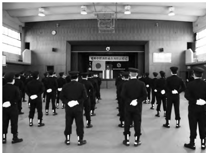
相楽中部消防出初式

Q 木津川市と精華町の一人一日当たりのごみ量を比べると本市の増加率が高い。要因は。