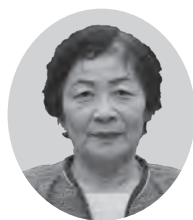
新風コスモスの会

A 教育部 府が主体に実施するよう要望し、整備計画は、府・市が協力し、作業を進める。