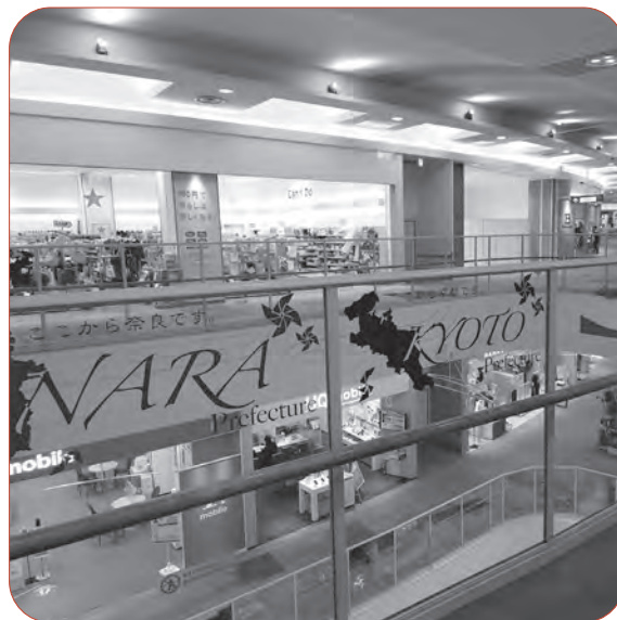
イオンモール高の原4階にマイナンバーセンターが移転

Q マイナンバーカードが欲しい時、まず何をしたらよいのか。 A 市民部 最初にマイナンバーサービスセンターに相談してもらう。センター以外にも、加茂支所、山城支所、市役所市民課でも相談を受け付けている。