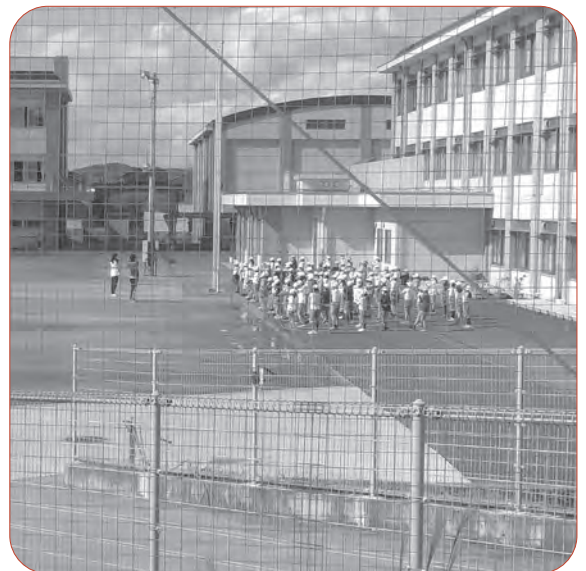
11月12日 んかるみの中、アスファルト部分で準備体操

③II期工事での重機は。④専門業者の調査が必要。 A 教育長・教育部 ①10ト車約70台が9日間と杭打機が2日間入った。②工事業者が砂の補充と整地・転圧した。③入る予定。④II期工事完了後に行う。