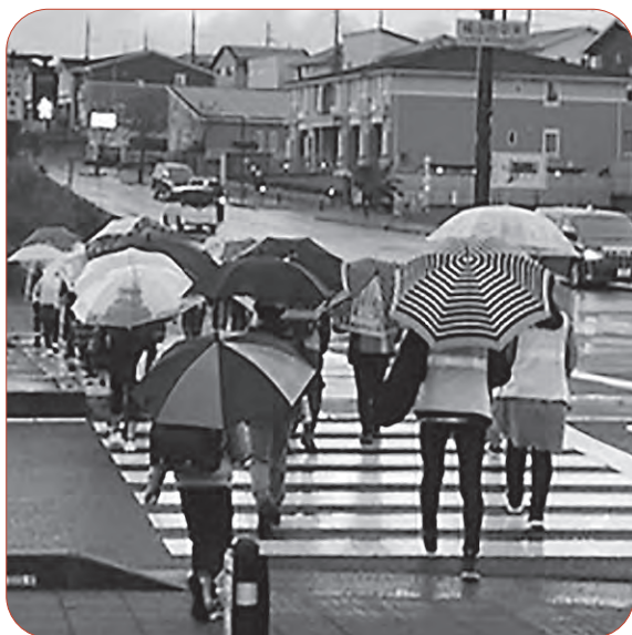
ボランティアの方々に見守られながら登校（城山台中央）

Q ①減便されたバス路線にコミバスは走るのか。②公募委員が規程に反していたのはなぜか。 A マチオモイ①公共交通協議会へ申し出があれば協議する。②上位規程と違いがあった。