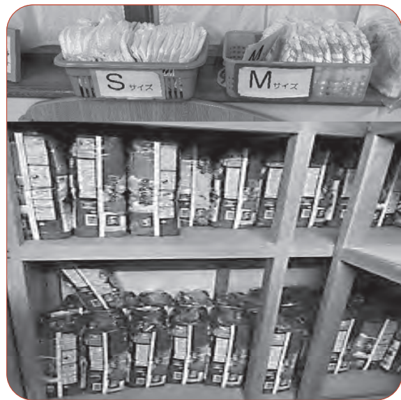
サブスクでおむつが利用しやすくなった（浦安市の保育園）

Q おむつとおしりふ きを使い放題できる 「おむつのサブスク」が 全国の保育園等で利用が 広がっている。保護者が 子どもと手をつないで登 園できるよう、市でも導 入する考えは。 A 教育部 他市の事例 等研究したい。