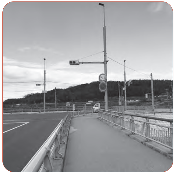
木津川架橋から延伸される予定の城陽井手木津バイパス