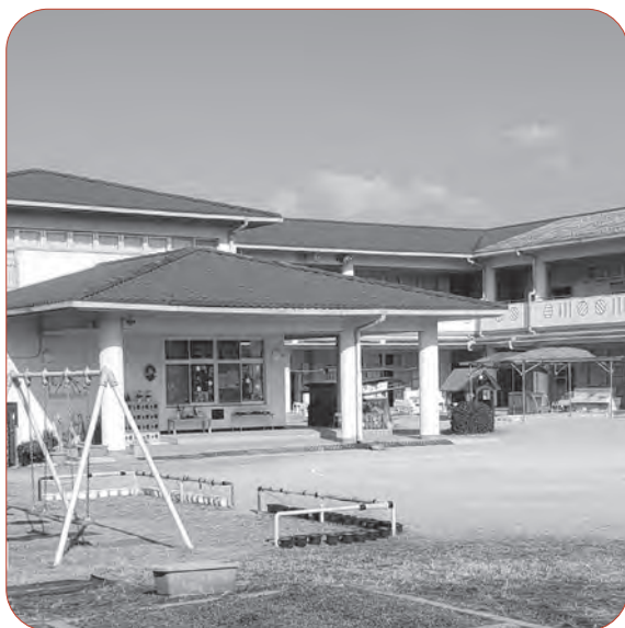
再編計画で閉園の危機にある高の原幼稚園

Q 3歳児定員を増や さず、施設の充実を 怠ったことで園児が減少 した。 高の原幼稚園の閉園な ど再編計画をやめ、定員 を増やし施設を充実せよ。 A 教育長・教育部 決 して定員の設定や管 理は怠っていない。幼児 教育の無償化で私立幼稚 園への希望者が増えた。