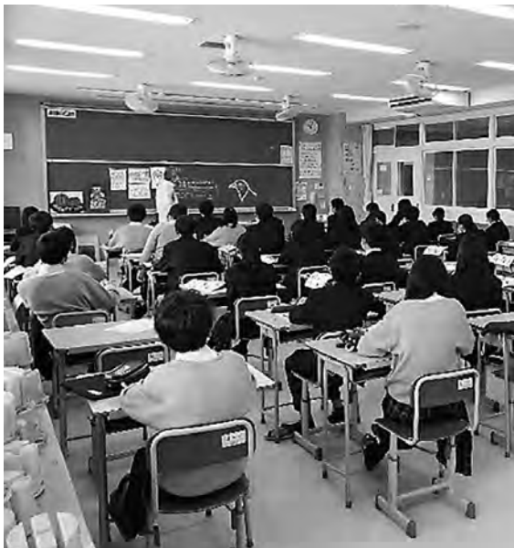
木津南中学校の授業風景

2月5日(土)に「市民と議会のつどい」を開催するため準備しておりましたが、市内でも新型コロナウイルスが再度感染拡大している状況を鑑み、市民の皆さまの安全と感染拡大防止を考え、残念ですが中止することとしました。