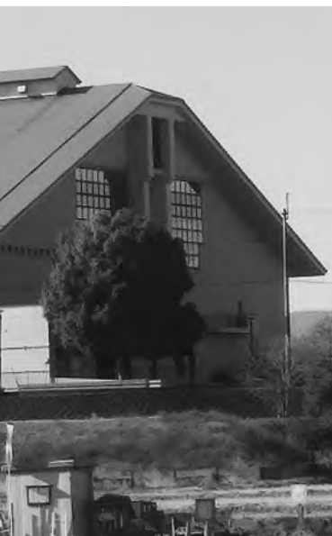
くなる中央体育館