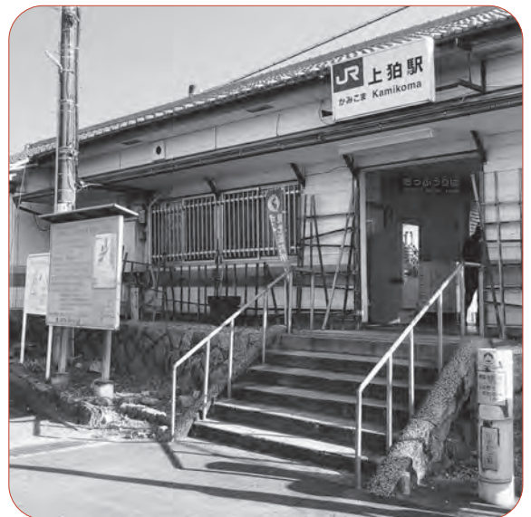
バリアフリー化が遅れている上狛駅舎

A 市長 基準に適したバリアフリー化は重要。毎年、JRと府へは複線化と併せて要望しており、今後も協議を進める。