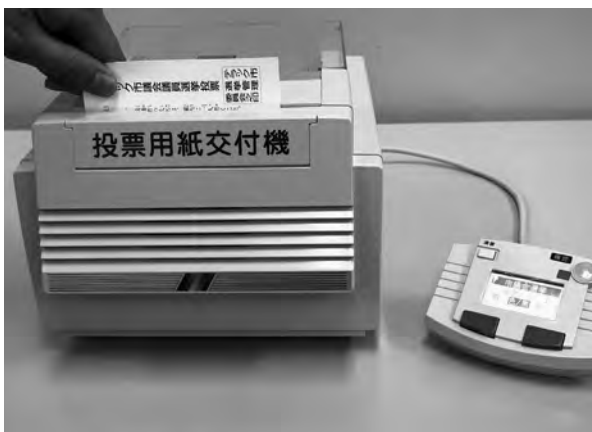
4月からの選挙で導入される (投票用紙自動交付機)