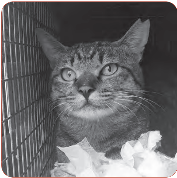
不妊去勢手術し耳カットされたさくらねこ