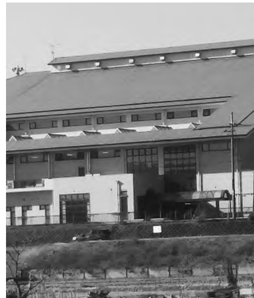
キャッシュレス化で利用しやすい