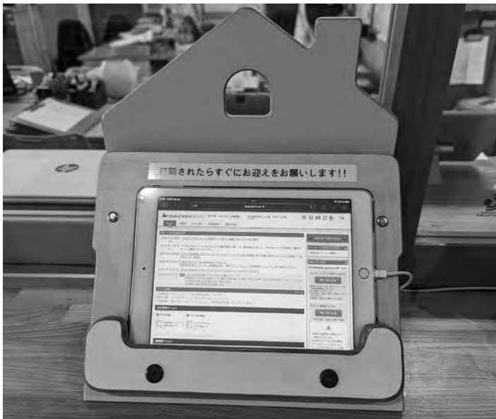
ICT化が進む保育現場（子どもの登退園などが管理できるタブレット）

Q 情報管理は大丈夫か。各事業所において、セキュリティ対策を講じ、運用管理する必要がある。