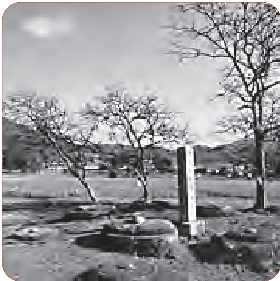
整備が待たれる史跡 恭仁宮跡（山城国分寺跡）