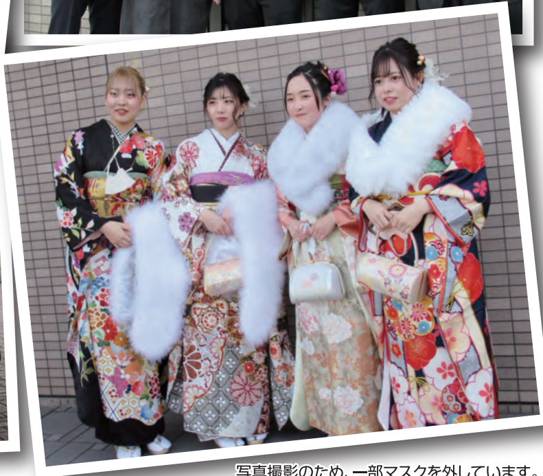
写真撮影のため、一部マスクを外しています。