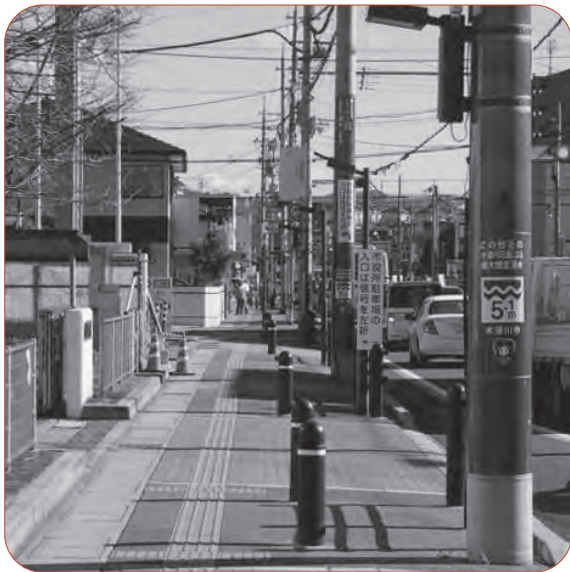
不安をあおるより成果も表示しては（5.1mの電柱標記）

Q 市の中心部を流れ る小川・反田川流域 は、人口密集地区や行政 機関などの重要エリアで あるが、過去に度重なる 水害が発生し甚大な被害 があった。 市は3年度に内水対策 事業費を計上し、排水ポ ンプ施設建設を決定した。 A 現時点の進捗状況と完 成予定時期は。 建設部 排水ポン プ施設の用地確保がで き、国・府との協議も順 調で、今後詳細設計を進 め5年度の稼働を目指す。 Q 豪雨で合同樋門が閉 鎖され内水排除が困難と