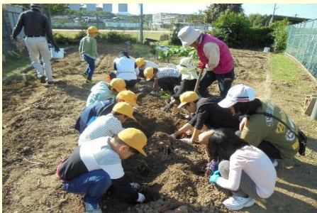
地域学校協働本部事業（収穫体験授業補助）