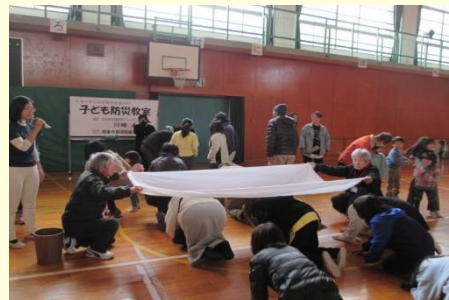
放課後子ども教室（防災教室）