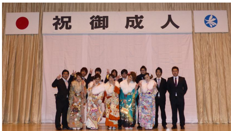
【平成 24 年度成人式実行委員】