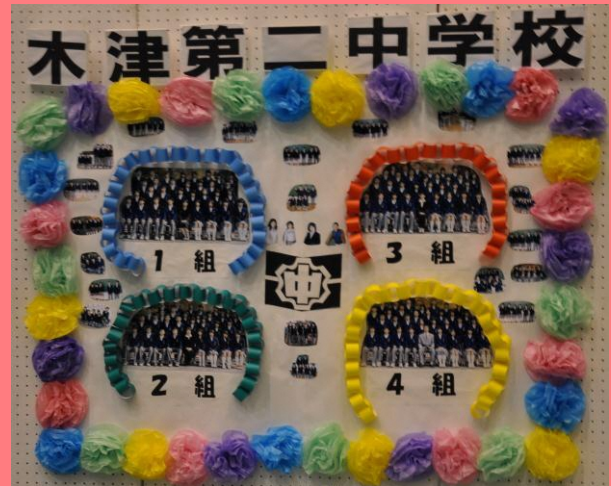
【木津第二中学校区】