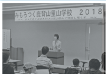
開校式市長あいさつ

第1回は開校式、オリエンテーションに続いて、木津北地区で活動する、NPO法人京都発・竹・流域環境ネットの活動地でタケノコ掘りをおこないました。