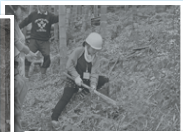
タケノコ掘り体験

4月に引っ越してきて、広報を見て応募しました。 子どもの頃楽しかった思い出を、自然の大切さを子どもたちにも伝えたいです。