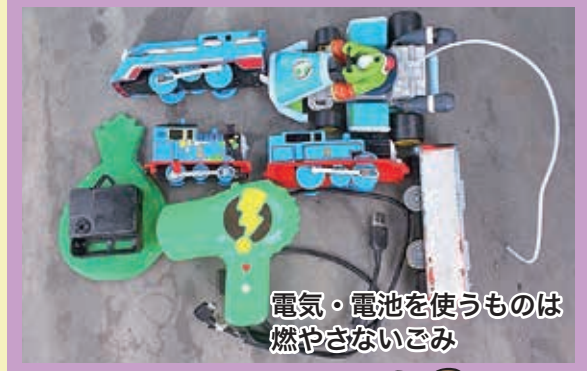
電気・電池を使うものは 燃やさないごみ