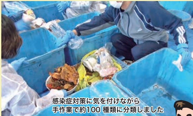
感染症対策に気を付けながら 手作業で約100種類に分類しました

今回調査のために回収した可燃ごみは、市内10地域の約294世帯から合計約500kgのごみを無作為にピックアップしました。