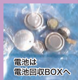
電池は 電池回収BOXへ