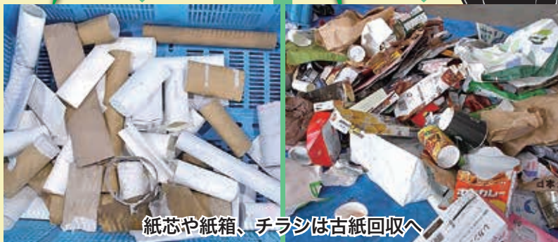
紙芯や紙箱、チラシは古紙回収へ