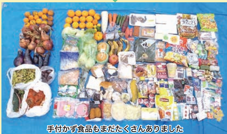
手付かず食品もまだまだたくさんありました