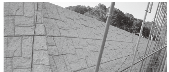
敷地前面にある府道沿いの擁壁が完成しました。(平成26年8月)