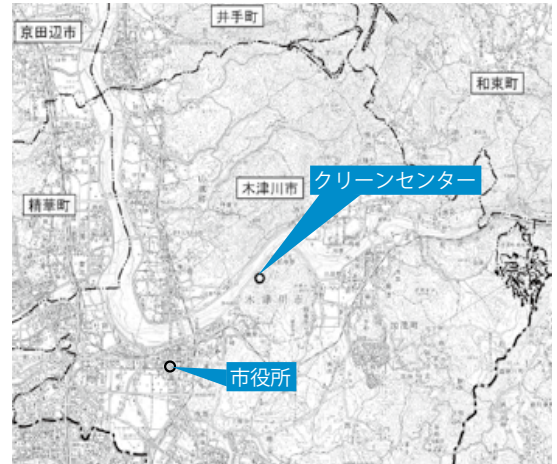
グリーンセンター敷地造成工事 位置図

グリーンセンター整備にあたり、地元の皆さんをはじめ市民の皆さん、一人ひとりのご理解とご協力をよろしくお願いします。