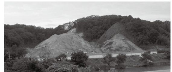
木津川対岸の国道163号から見た現場状況(平成26年9月)