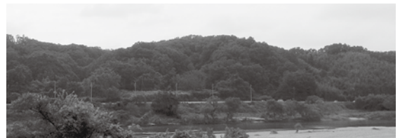
木津川対岸の国道163号から見た現場状況(着手前)