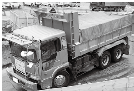
埋設廃棄物を運搬するダンプには、シートを掛けています