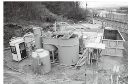
埋設廃棄物の撤去中に濁水が発生した場合は、この装置で除去します

クリーンセンター整備にあたり、地元の皆さんをはじめ市民の皆さん、一人ひとりのご理解とご協力をよろしくお願いします。