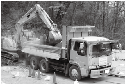
埋設廃棄物の積み込みの様子

工事期間中、皆さんに何かとご迷惑をお掛けしますが、ご協力くださいますよう、よろしくお願いします。