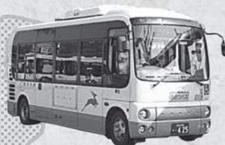
きのつバス・奈良交通バス