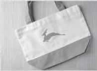
路線トートバック