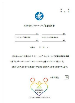
パートナーシップ・ファミリーシップ制度 宣誓証明書（A4 サイズ）

あなたの周りにこの制度があることで救われる人がいるかもしれません。木津川市が、誰もが安心して自分らしく生きられる地域であるために、まずはこの制度のことを知ることから始めてみませんか。 宣誓方法等詳細については木津川市ホームページをご確認ください。