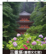
三重塔(継尊文化財)