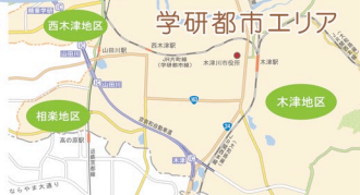
きつぷろ科学館ふたごん けいはんな学研都市 日本電子力研究開発機構 関西科学研究所 MAP 05