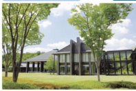
RIKEN国際高等研究所 (IIAS) MAP 1

国際高等研究所は、産・学・官の支援のもと、1984年に財団法人として設立されました。従来の学術分野を超えた学際・学際を超えた分野を超えた交流と協働により、未知の学術の領域に新たな学術的発見を、次の世代に向けた学術の芽を育みつづける活動を中心とすることなく、近未来の人物の育成に對して継続的に学術の芽を育てていくことに、我が国が国際学術研究の発展に貢献することを自覚しています。