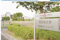
同志社大学(学研都市キャンパス) MAP 1

同志社大学 5 番目のキャンパス、敷地面積 50,000 ㎡、建物延床積 8,500㎡の用地を、医工連携を念頭に、新たな理工系研究施設として活用。今後、関西文化学術研究都市や近畿圏個人ととの共同研究、地域民との交流を望み、21世紀に求められる新たな学術フロンティア開拓の拠点を目指しています。