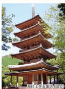
滝住山寺五重塔(国宝)

滝住山寺は、天平7年(735)、聖武天皇の勅諭により、東大寺の良弁僧正が創始したと伝えられています。山上の伽藍は向東が僧院でしたからのもので、本堂の傍らにそびえる五重塔は、山並みに映える鎌倉時代の傑作で、国宝に指定されています。十一層観音立像や文殊坐像、絹本彩色法華経善養經画、滝住山寺文書をはじめもとの重要な文化財に指定されています。