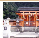
御霊神社 本殿(重要文化財)

加茂町荒基に位置し、元は明神寺の鎮守社。明神寺の建物等も橋筋の三深淵に移築されたため、跡地には本尊などを安置する収蔵庫が設置されています。