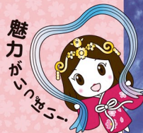
木津川市マスコットキャラクター いづみ姫