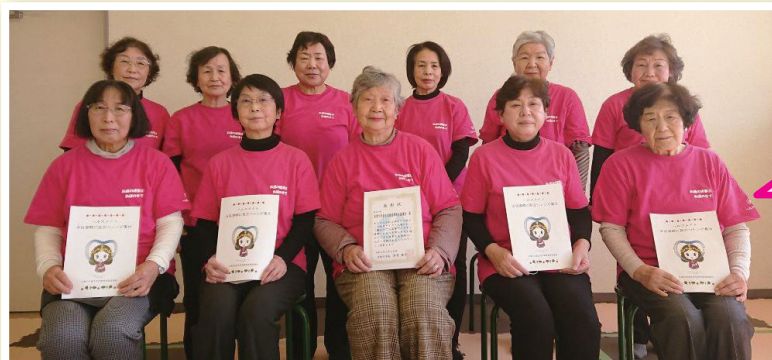
▼協議会の役員の皆さん。全42名の方が活動されています。