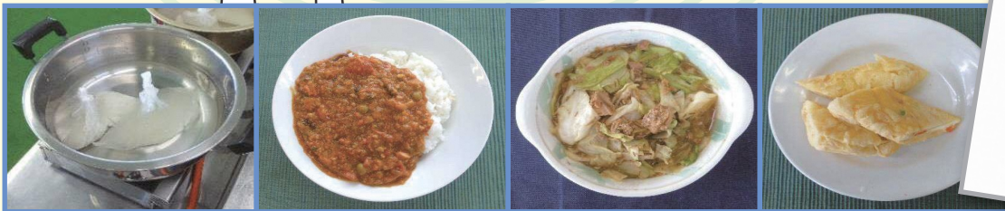
▲湯せん調理で、「ごはん」「カレー」「煮物」「蒸しケーキ」など色々!