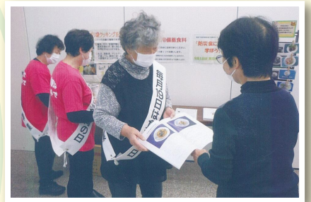
昨年9月には備蓄食料やレシピの配布も行いました