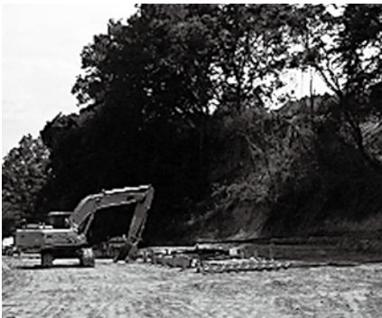
6月初旬の現場状況

敷地造成工事の進捗に伴い、残土処分のための車両がやむを得ず増加することとなり、沿道の皆さんには、大変ご迷惑をお掛けしますが、これまで以上に、安全運転に心がけますので、ご理解とご協力をよろしくお願いします。