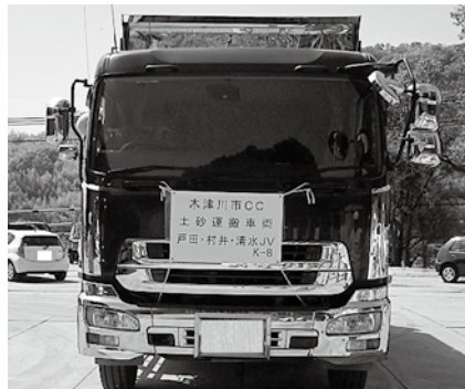
残土運搬車両にはゼッケンを付けています。