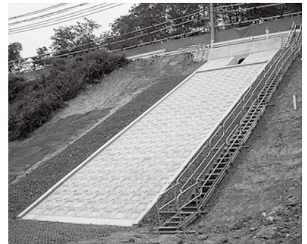
木津川から見た雨水排水管整備の様子